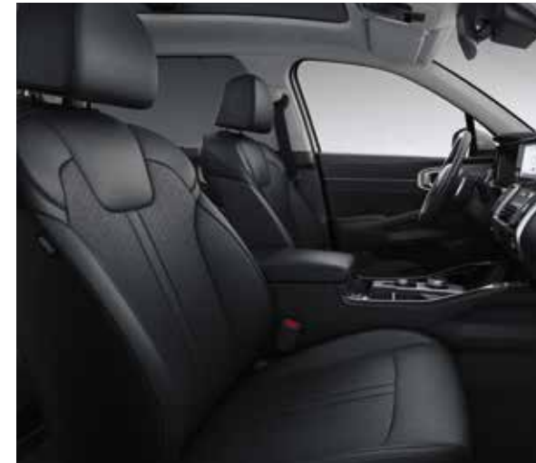
Zwarte lederen zetelbekleding (standaard op Sense, optie op More via Style Pack)