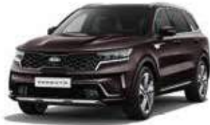
Essence Brown (BE2)