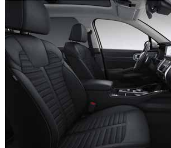
Zwarte stoffen zetelbekleding (standaard op More)