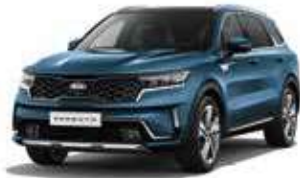
Mineral Blue (M4B)