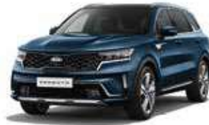
Gravity Blue (B4U)