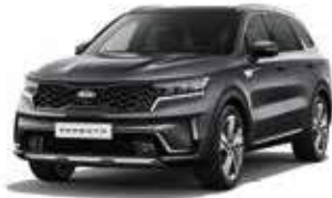
Platinum Graphite (ABT)