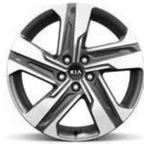
19" lichtmetalen velgen met 235/55 banden Standaard op More PHEV en Sense HEV-Diesel-PHEV