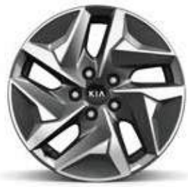
17" lichtmetalen velgen met 235/65 banden Standaard op More HEV