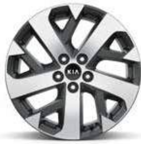
18" lichtmetalen velgen met 235/60 banden Standaard op More Diesel