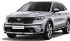
Silky Silver (4SS)