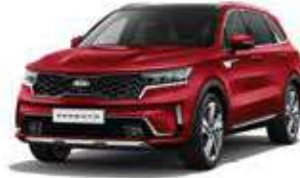
Runway Red (CR5)