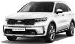
Snow Pearl White (SWP)