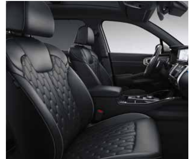
Zwart Nappaleder met grijze stiksels en bies (optie op Sense via Luxury Tech Nappa Pack)