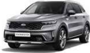
Steel Grey (KLG)