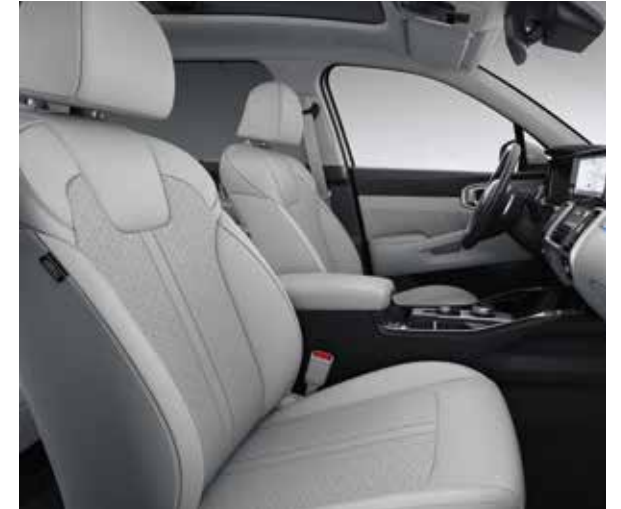
Grijze lederen zetelbekleding (standaard op Sense, optie op More via Style Pack)