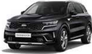
Aurora Black Pearl (ABP)