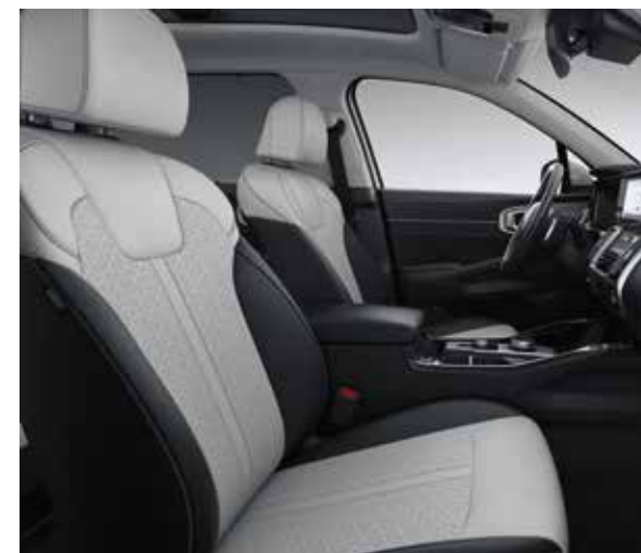
Tweekleurig Grijs-Zwarte lederen zetelbekleding (optie op Sense via Luxury Tech Pack)