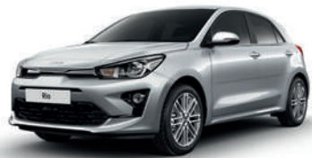
Silky Silver [4SS]