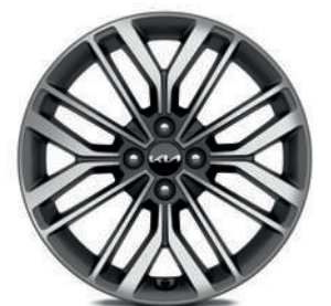
Jantes en alliage 17" avec pneus 205/45 (de série sur GT Line)