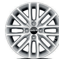
Jantes en alliage 15" avec pneus 185/65 (de série sur Pulse, option via Pack Connect sur Pulse)