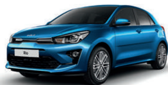
Sporty Blue [SPB]