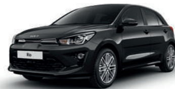
Aurora Black Pearl [ABP]