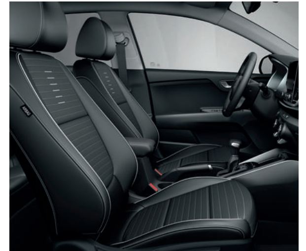
Sellerie mi-tissu / mi-cuir artificiel noir (de série sur GT Line)