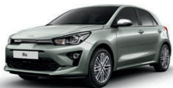
Urban Green [URG]