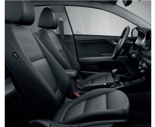
Sellerie en tissu noir (de série sur Pulse)