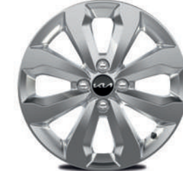
Jantes en alliage 16" (incluses dans le Pack Navigation sur Pulse)