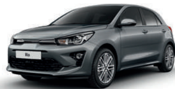
Perennial Grey [PRG]