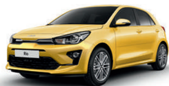
Most Yellow [MYW]