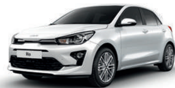
Clear White [UD]**