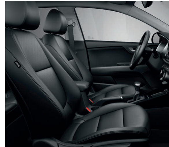
Sellerie en cuir artificiel (inclus dans le Pack Comfort sur Pulse)