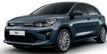
Smoke Blue [EU3]