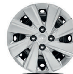
Jantes en acier 15" avec pneus 185/65 et enjoliveurs (de série sur Pure)