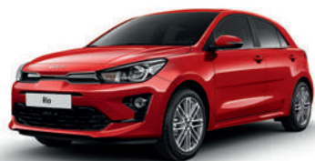
Signal Red [BEG]