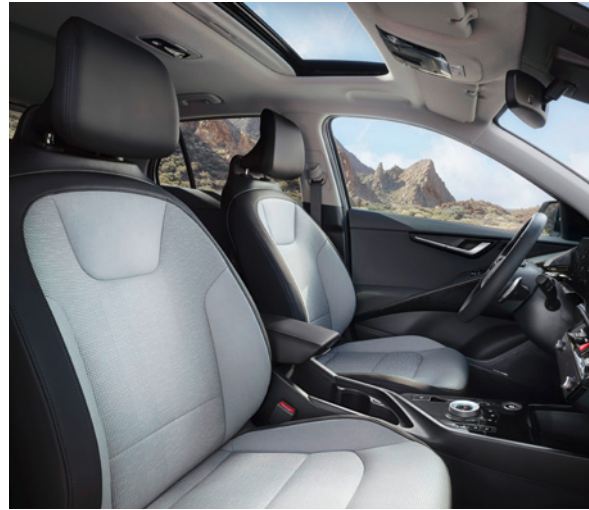
Cuir artificiel - Gris (de série sur Pace) Kunstleder - Grijs (standaard op Pace)