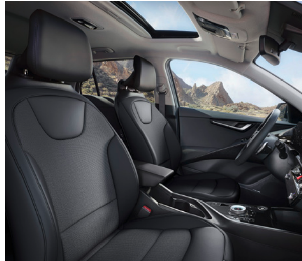
Tissu/Cuir artificiel - Noir (de série sur Pulse) Stof/Kunstleder - Zwart (standaard op Pulse)